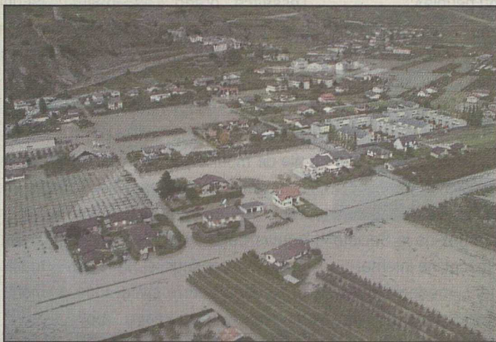
Un spectacle que l'on ne veut plus voir.

Au programme: Première partie: l'inondation de Saillon en octobre 2000; deuxième partie: gérer le risque d'inondation en Valais.