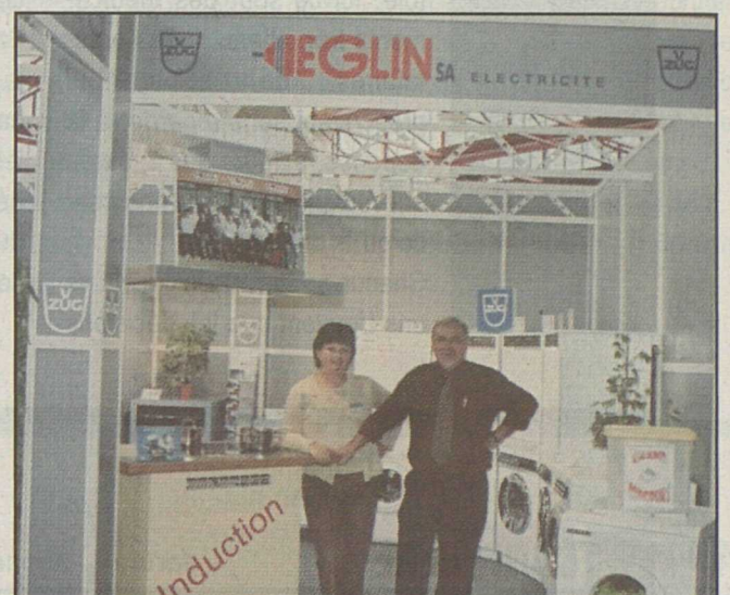
Ils sont 357 à se présenter au public comme la maison Eglin.