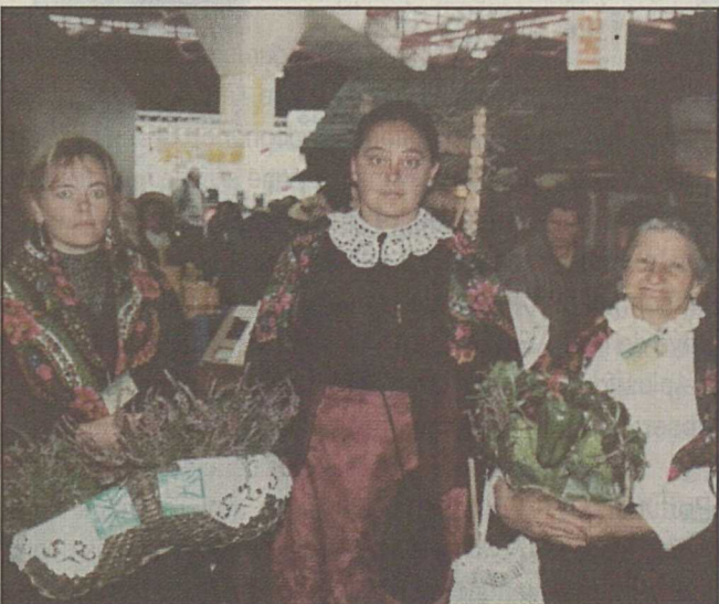
Nos cousins italiens dans leurs chatoyants costumes.

21 h: Fermeture de la 46 e Foire du Valais.