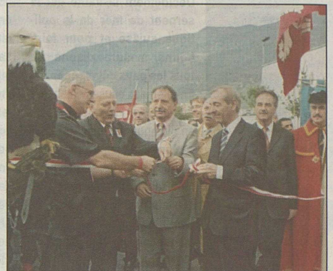
Couper de ruban sous l'œil attentif de l'aigle américain!