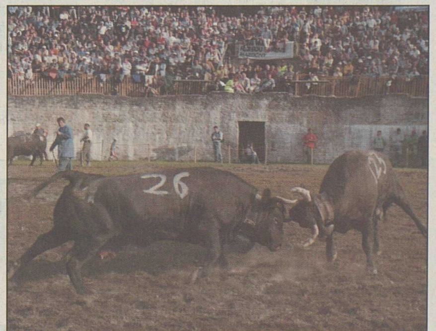
Si le soleil est au rendez-vous, le combat de reines de ce dimanche tiendra toutes ses promesses.