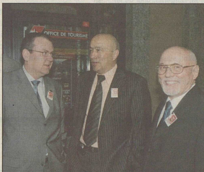
Les responsables de Provinces, hôtes d'honneur.