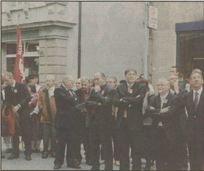
Les officiels devant l'Hôtel de Ville de Martigny.