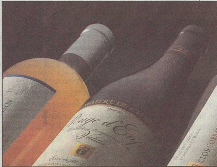
Provins marque à la fois le passé et le futur de l'agriculture valaisanne.