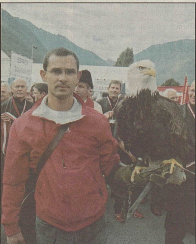
Une grande attraction de cette 46 e édition: la fauconnerie.