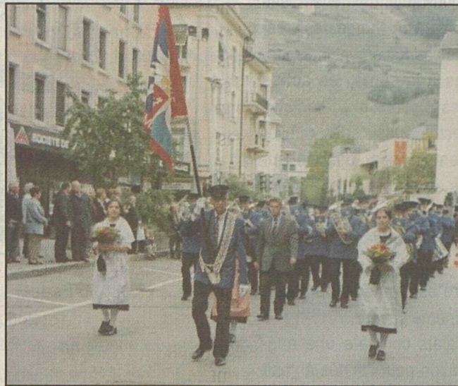
L'Edelweiss de Martigny, lors du défilé.