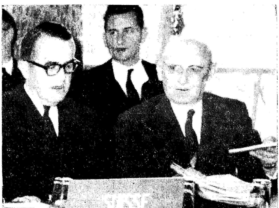
DÉBUT DE LA CONFÉRENCE ÉCONOMIQUE EUROPÉENNE A PARIS

b) les rapports entre les Sections et le Siège central.