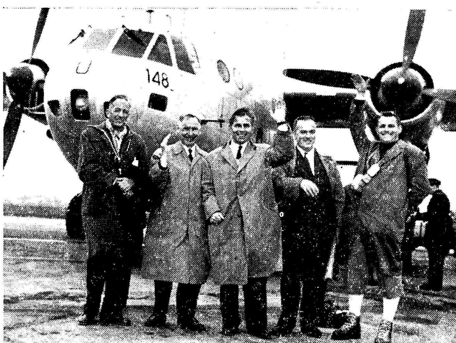
LES PARTICIPANTS SUISSES A L'EXPEDITION INTERNATIONALE AU GROENLAND SONT PARTIS

H. Kummer, rue des Hôtels, Tél. 026 - 6 19 74, Martigny