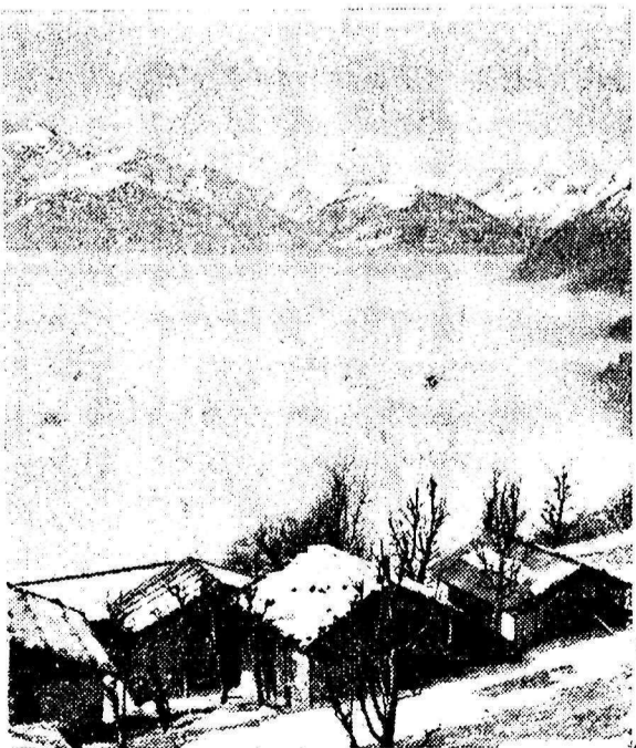
Un village isolé du monde

Pour toutes les questions de détail, les sous-officiers, soldats, SC armés astreints à l'inspection doivent consulter les affiches placardées dans les communes et les gares, ou déposées dans les postes de la gendarmerie cantonale et chez les Chefs de section : ces derniers sont au surplus à disposition pour donner les renseignements utiles sur présentation du livret de service.