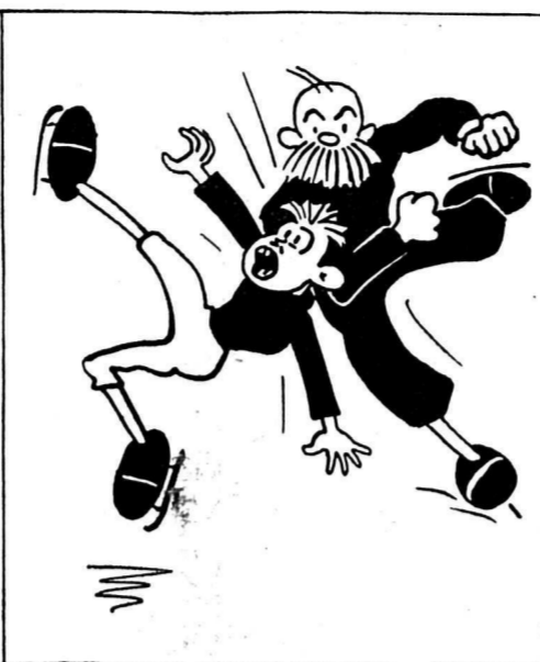
Mais soudain c'est la catastrophe : Il heurte un vieux qui l'apostrophe.