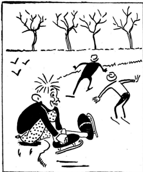
Le patin, quel sport merveilleux Se dit Arthur, qui file, joyeux.