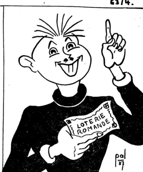
Mais quel malheur vous frappe, je vous l'demande, Quand on a un billet de la Loterie romande.