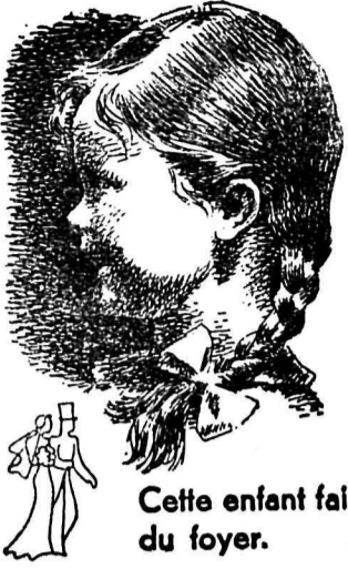
Cette enfant fait le bonheur du foyer.

Elle ne restera pas toujours sous la garde de ses parents. Le temps passe vite et, dans une douzaine d'années, elle sera majeure.