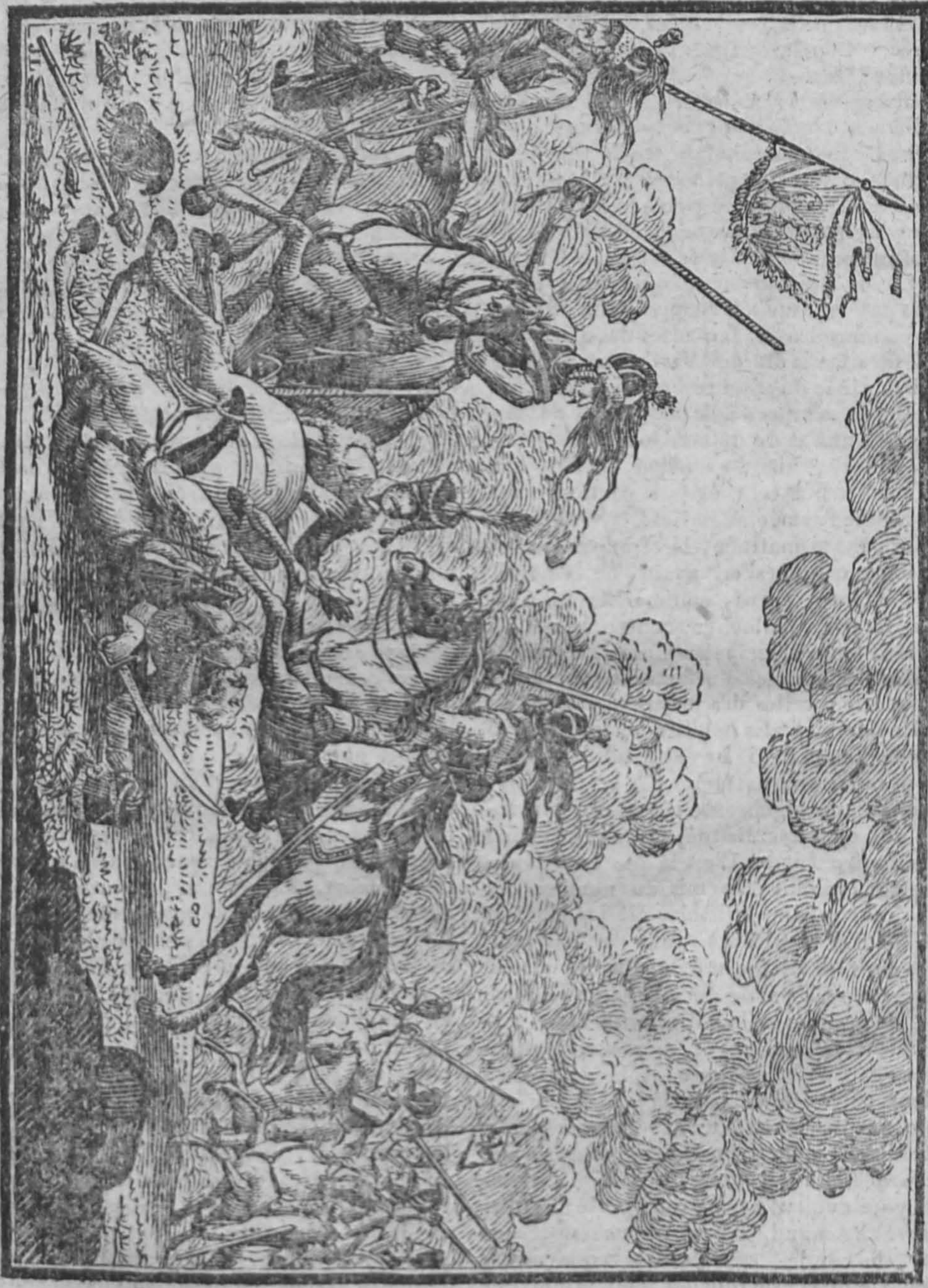
Dangers courus par le prince de Blucher à la journée du 16 Juin 1815.