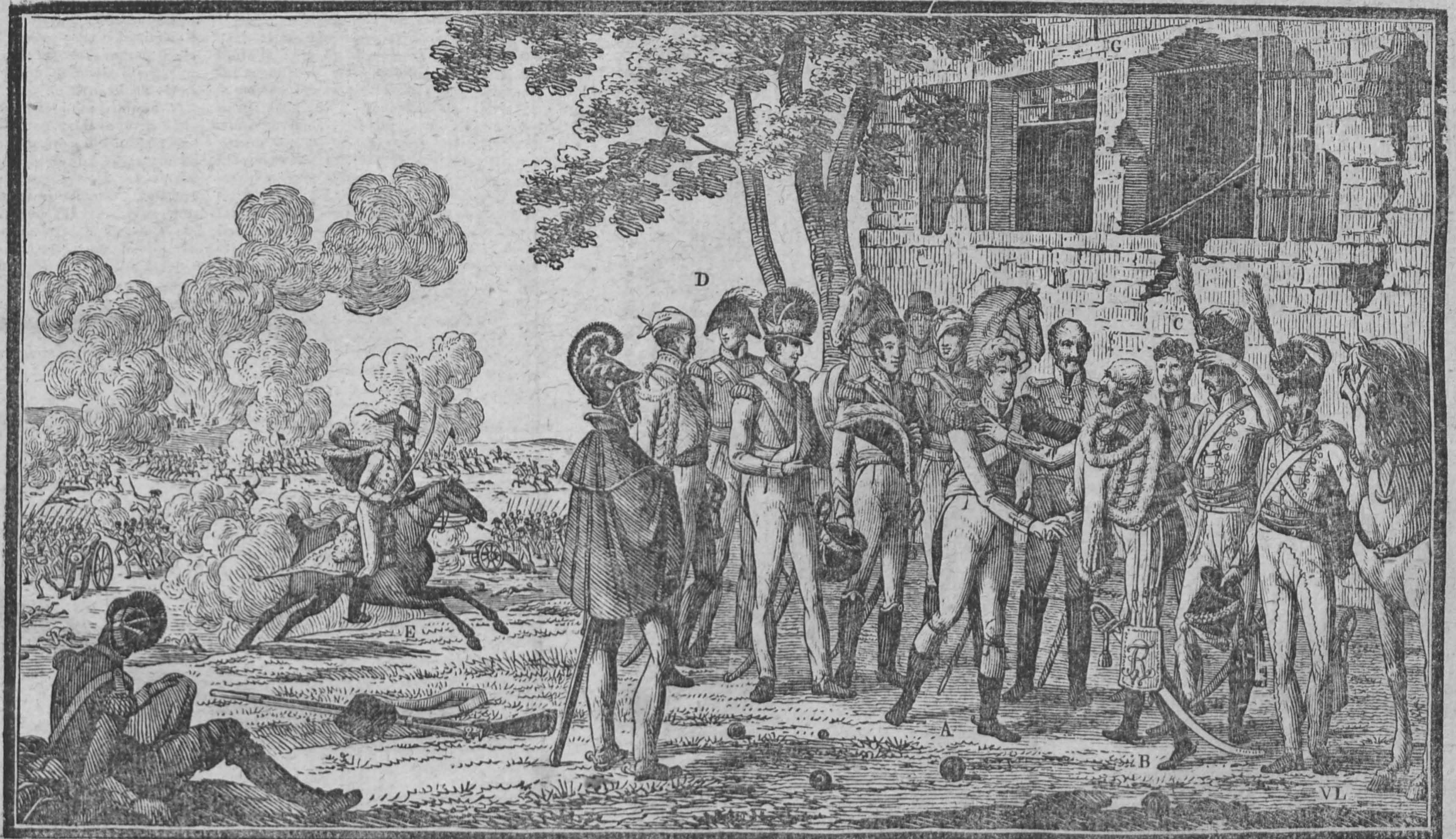
A. Le duc de Wellington et le prince Blücher se saluent mutuellement comme vainqueurs. C. Officiers d'Etat-major du prince Blücher. D. Officiers d'Etat-major du duc de Wellington en majeure partie blessés. E. Un aide de camp porteur d'ordres. F. Vue d'une partie de la bataille. G. La ferme de la Belle-Alliance criblée de coups de canon.