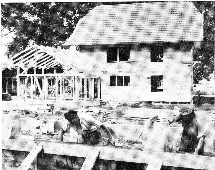
(Corr. part. de «L'Impartial»)