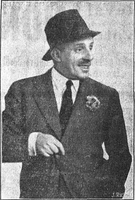
Une photo d'Alphonse XIII prise lors d'un de ses voyages en Suisse romande.