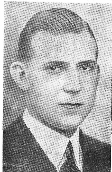
Don Juan-Carlos, qu'on désigne comme l'héritier éventuel de la couronne d'Espagne.

Alfonso XIII, Léon-Ferdinand-Marie-Jacques-Isidore-Pascal-Antoine, ci-devant roi d'Espagne, de Castille, d'Aragon, des Deux-Siciles, de Jérusalem, de Navarre, de Grenade, de Tolède, de Valence, de Galice, de Majorque, de Minorque, de Séville, de Cordoue, de Corcega, de Murcie, de Juan, d'Algarve, d'Algezire, de Gibraltar, des Îles Canaries, des Indes orientales et occidentales, de l'Inde et du continent océanien, archiduc d'Autriche, duc de Bourgogne, de Brabant et de Milan, comte de Habsbourg, de Flandre, de Tyrol et de Barcelone, seigneur de Viscaye et Molina; Feldmarshall de l'armée britannique, colonel en chef du 16 me régiment de lanciers, amiral de la marine suédoise, chef et souverain de l'Ordre insigne espagnol de la Toison d'Or, bailli et grand croix d'honneur de l'Ordre de Malte, chevalier de l'Ordre de l'Aigle Noir, de l'Éléphant, de l'Annonciade, de St-