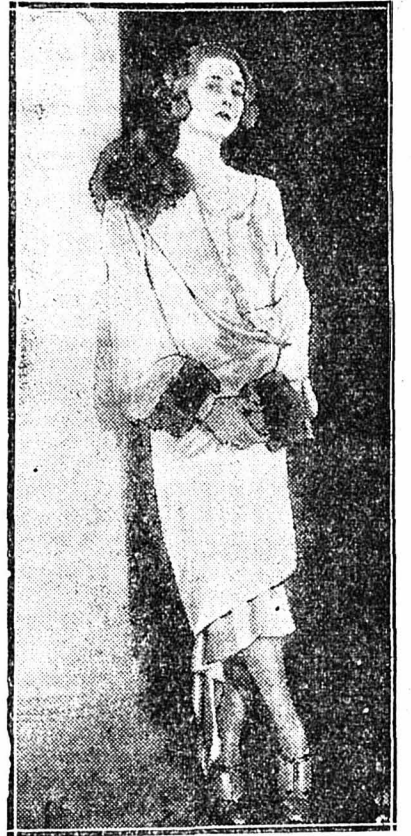
La marquise di Bertolino de Palerme vient d'être déclarée par un comité d'experts « la femme la plus distinguée du monde ».