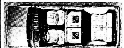
les pique-niqueurs et les peinaras.