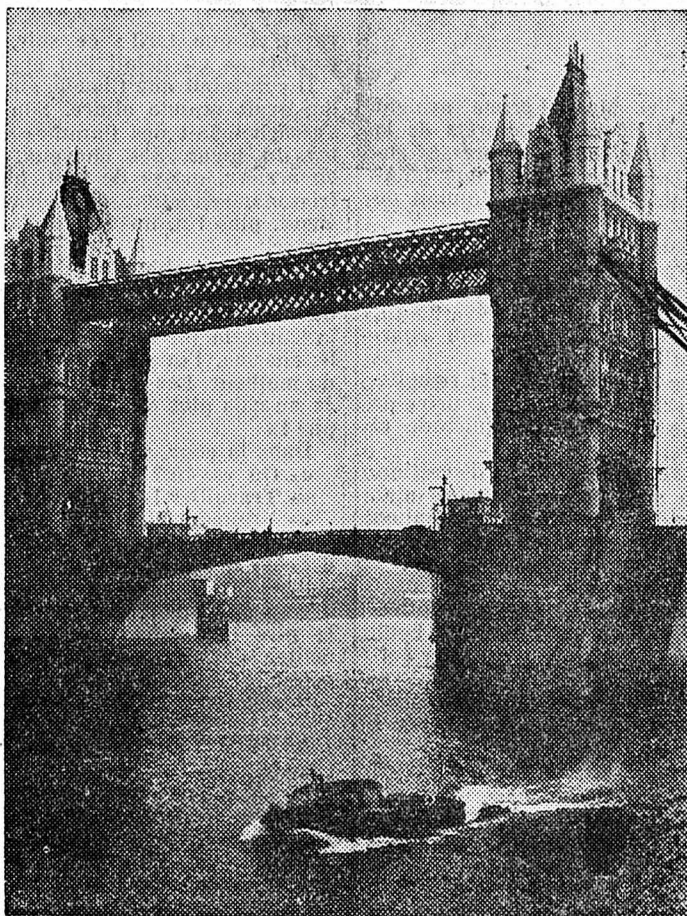
Le célèbre pont de la tour de Londres.