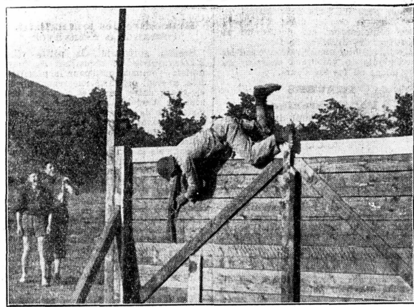
Un sous-officier dans le feu de l'action I...

Classement des sections J.S.R.O. 1947 Fusil : 1. Biemme Romande ; 2. la Chaux-de-Fonds ; 3. Neuchâtel. Pistolet : 1. le Locle ; 2. Neuchâtel ; 3. la Chaux-de-Fonds. Grenades : 1. Morat ; 2. Boudry ; 3. Neuchâtel ; 4. Biemme Romande ; 5. Val-de-Ruz.