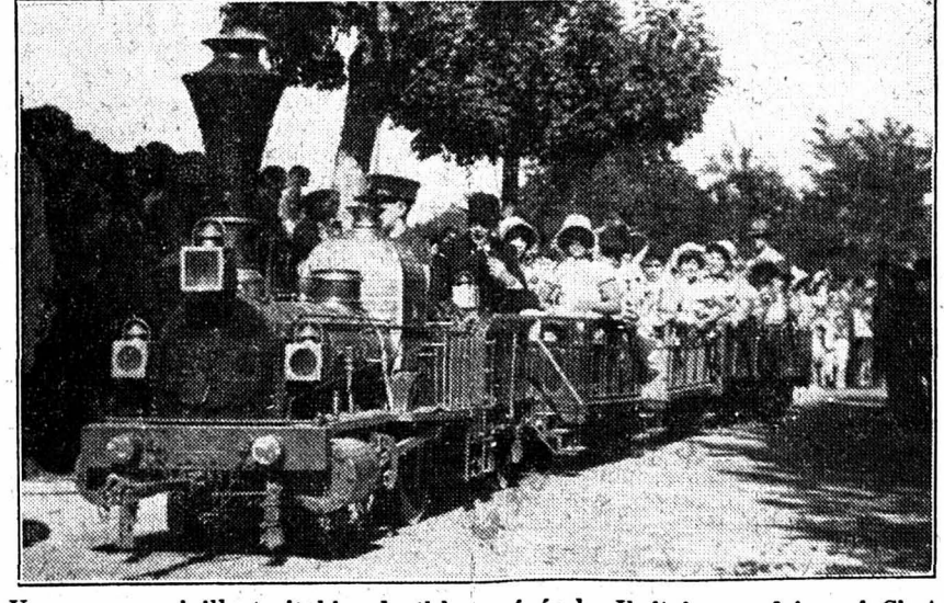
Un groupe qui illustrait bien le thème général « Il était une fois... » ! C'est une fidèle reproduction de l'image que nous ont donnée les C.F.F. du fameux « Spanisch Brötdli-Bahn », aujourd'hui vieux de cent ans.

Après le cortège, la place de la foire, le jardin public et le bord de la rivière sont bientôt envahis par une foule assouffie. Et la fête continue, animée par les productions des sociétés invitées.