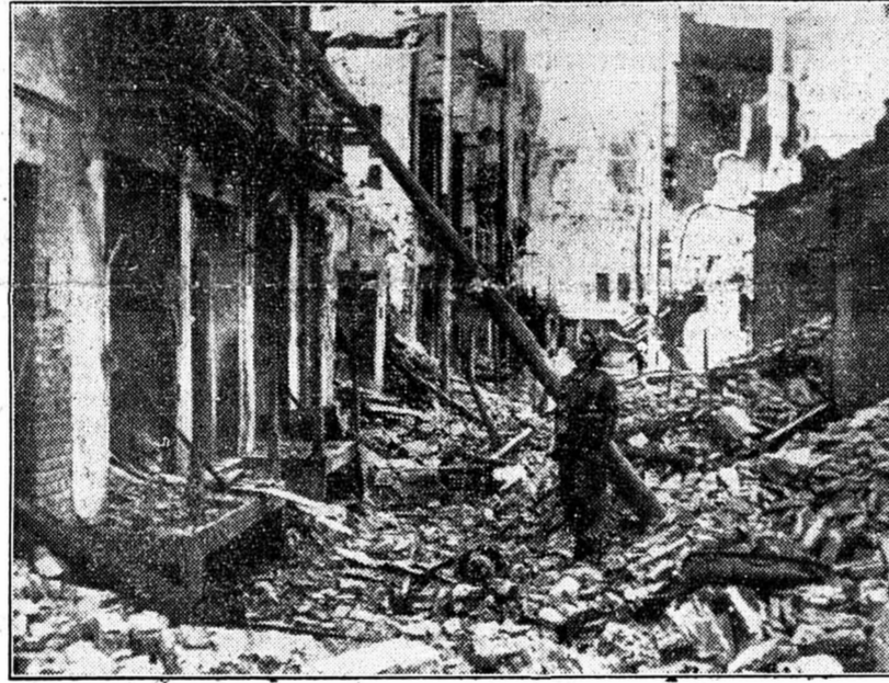
La création des deux Etats de l'Hindoustan et du Pakistan n'a pas réussi à ramener le calme aux Indes et chaque jour de nouvelles bagarres éclatent entre Musulmans et Hindous, notamment dans le Pendjab. Voici une rue de Lahore où les troubles ont été particulièrement sanglants.