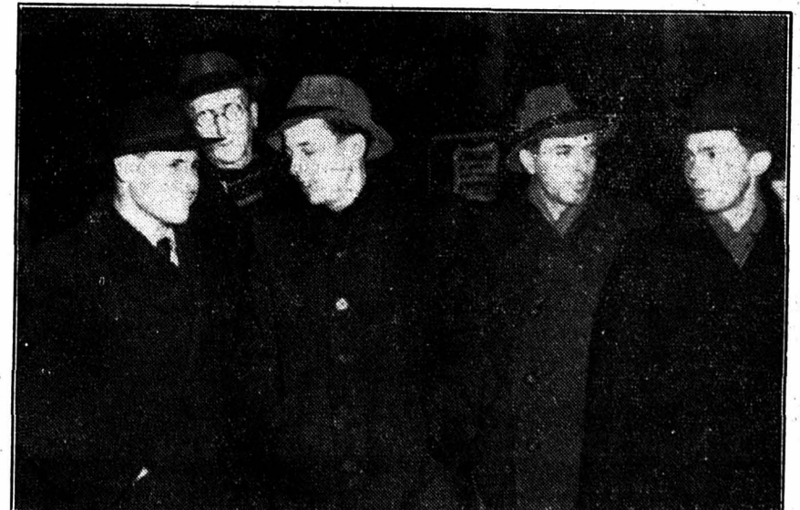
Ces cinq ingénieurs allemands spécialisés dans la construction des « V2 » viennent d'arriver à Londres où ils poursuivront, pour le compte des autorités militaires britanniques, leurs recherches dans le domaine des armes secrètes.