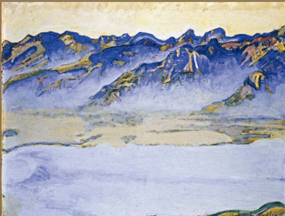
Ferdinand Hodler La montée des brouillards sur les Alpes Savoyardes, 1917, Huile sur toile

Vingt minutes, une œuvre : les concerts ayant lieu au MAH sont précédés par une présentation d'une œuvre de Ferdinand Hodler en lien avec la thématique du concert.