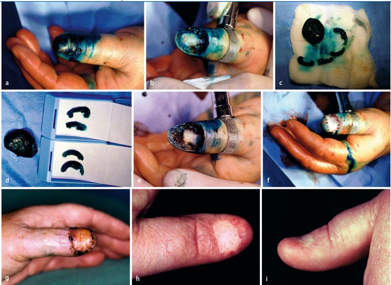
Abb. 3 ▲ Subunguales Melanom (Tumordicke 3,25 mm, Level V) am linken Daumen einer 54-jährigen Patientin. a Präoperativ. b Exzision des Tumors einschließlich des gesamten Nagelapparates bis zum Knochen der Endphalanx mit einem Sicherheitsabstand von 5 mm. c Präparation des Randes vom Exzizat in 4 Teilstücken (0.00–3.00 Uhr, 3.00–6.00 Uhr, 6.00–9.00 Uhr, 9.00–12.00 Uhr). d Histologische Einbettung der Randstücke. e Resektion des Processus unguinatus. f Defektdeckung mit einem Vollhauttransplantat. g Klinischer Befund 1 Woche postoperativ. h, i Hervorragendes funktionelles und kosmetisches Ergebnis 6 Monate postoperativ. (Aus [21])

stand und, wenn notwendig, nur partieller Endgliedresektion (Processus unguinatus). Mit Skalpell und Schere wurden en bloc der klinisch sichtbare Tumor, Nagelbett und Matrixhörner mit einem initialen Sicherheitsabstand von 5 mm entfernt. Der Defekt wurde dann durch die Kombination einer modifizierten Fischmaulplastik von volar und einer Vollhautplastik gedeckt. Die Operation lässt sich in örtlicher Betäubung mit einer Blutsperre durchführen (■ Abb. 3 ). Es wurde, wie in ■ Abb. 1 beschrieben, eine 3D-Histologie durchgeführt.