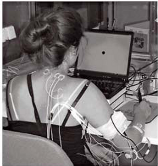
Abbildung 1: Messapparatur zur Bestimmung des EMG bei Maximalkraft (linkes Bild) und Positionierung der Elektroden (rechtes Bild). Die Sitzfläche erlaubt eine stabile Position des gegen hinten fixierten Körpers. Die Beine schweben über dem Boden, damit sie nicht zur Kraftausübung eingesetzt werden können. Die Messelektroden lagen im medialen Drittel der Linie Akromion-C7, damit die Filzpolster bei der Maximalkraftmessung genügend weit von den Elektroden entfernt waren. Diese Lokalisation wurde mit den Autoren von „SENIAM“ besprochen, entspricht jedoch nicht den aktuellen Empfehlungen (SENIAM (2012)).

worth-Filter 2. Ordnung bei einer Grenzfrequenz von 20 Hz aufgenommen. Eine genaue visuelle Kontrolle aller einzelnen Messungen zeigte für alle EMG-Aufnahmen innerhalb der mittleren zwei Sekunden der Muskelkontraktionen eine konstante Aktivierung des Trapezmuskels. Von diesen mittleren stabilen EMG-Registrierungen der einzelnen Testkontraktionen wurden Mittels des Programms Matlab für konsekutive 60 ms lange Zeitfenster RMS-Wert (Effektivwert) berechnet. Berichtet werden die mittleren Medianwerte der beiden Messungen von jeweils zwei Sekunden für die acht Positionen.