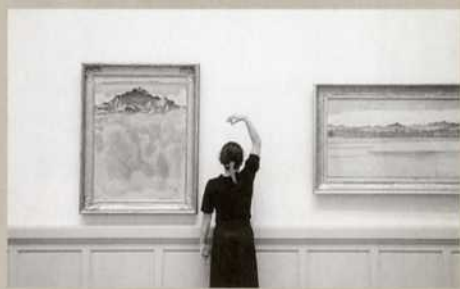
Aurore danse les montagnes en mouvement.