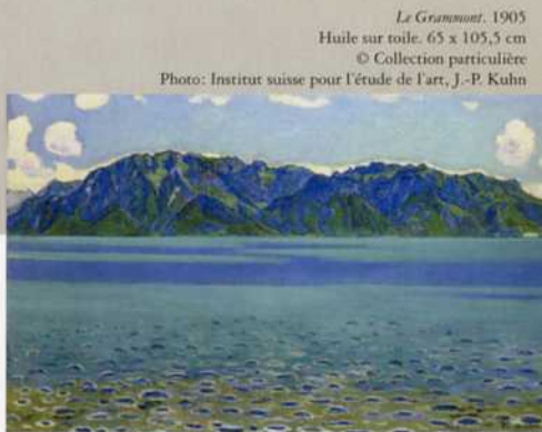
Le Grammont, 1905 Huile sur toile. 65 x 105,5 cm © Collection particulière Photo: Institut suisse pour l'étude de l'art, J.-P. Kuhn

to continue his studies in Geneva from 1873 to 1877 with Barthélemy Menn.