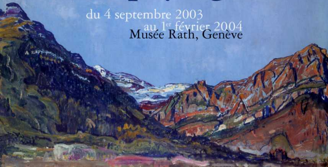
Paysage près de Champéry. Vers 1913 Huile sur toile. 60 x 79 cm © Winterthur, Museum Oskar Reinhart am Stadtgarten

du 4 septembre 2003 au 1 er février 2004 Musée Rath, Genève