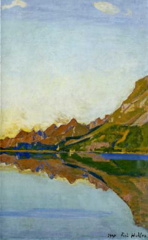
Le Lac de Silsaplana en automne, 1907 Huile sur toile. 71 x 92,5 cm Legs R. Schwarzenbach