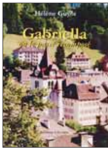
Editions à la carte

Dans la soirée, lorsqu'ils se décidèrent enfin à rentrer, la nuit était si sombre que Valentin dut allumer une lanterne pour retrouver le chemin de la ferme.