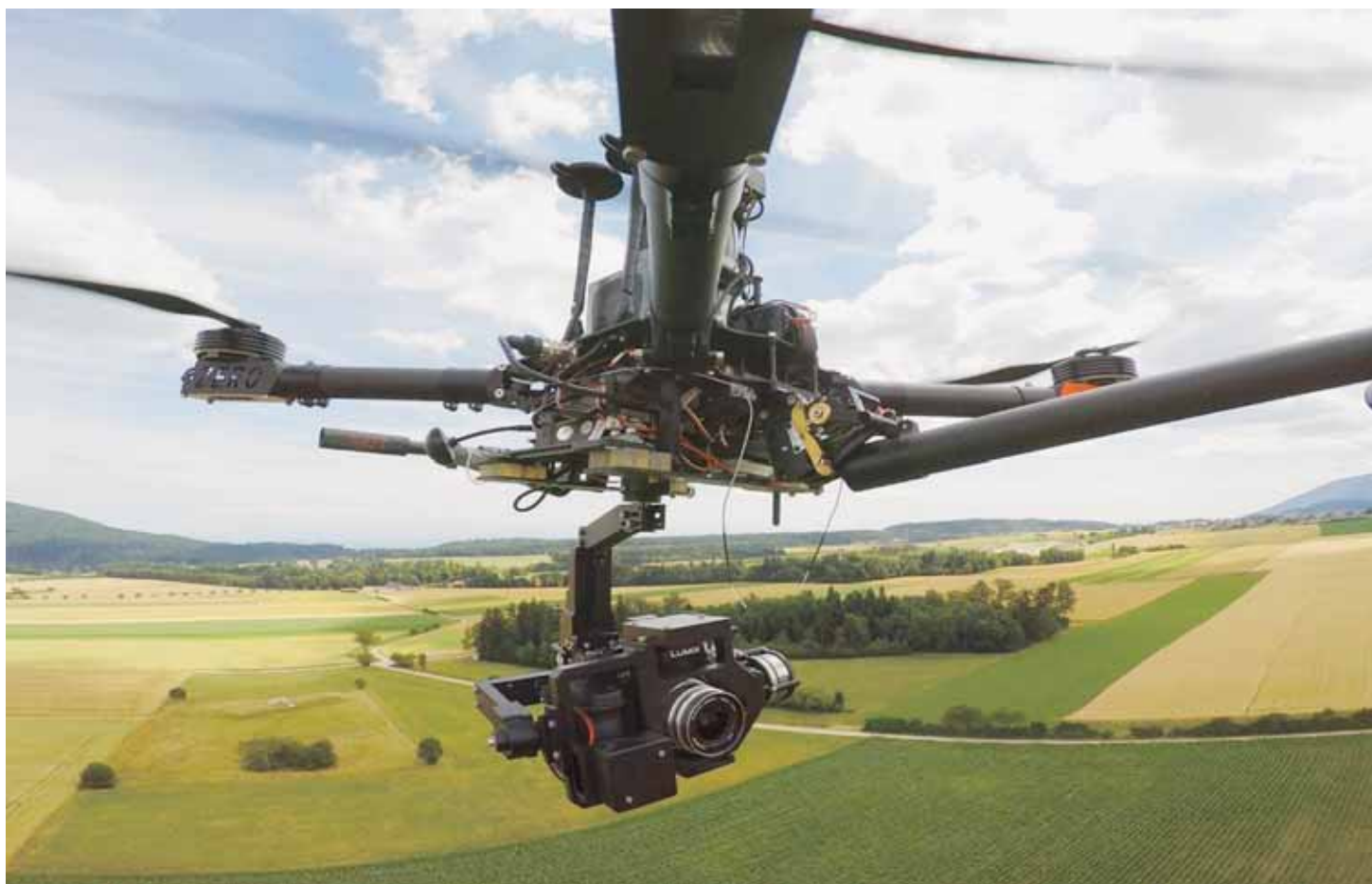
La société de Cortaillod Toast Air a pris le pari d'engager un pilote de drone à plein temps, une première en Suisse romande.

En Suisse, la législation en la matière ne pèse pas beaucoup plus lourd qu'un drone. Ciel dégagé? «Au contraire. Cette situa-