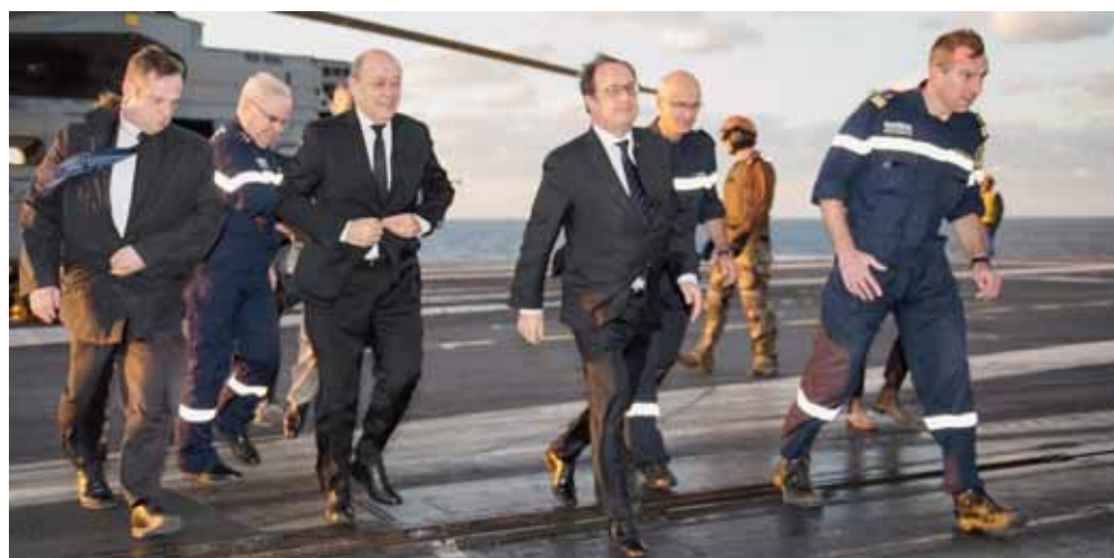
François Hollande (au centre) à son arrivée sur le «Charles-de-Gaulle» en compagnie du ministre français de la Défense, Jean-Yves Le Drian (à sa gauche).

Hier, François Hollande s'est rendu sur le «Charles-de-Gaulle», déployé en Méditerranée pour participer aux opérations en Syrie et en Irak contre l'Etat islamique. Le porte-avions poursuivra ces prochains jours sa mission dans