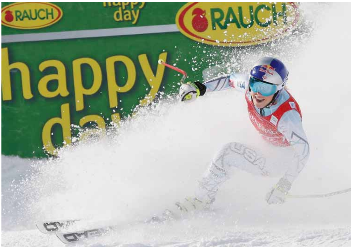
L'Américaine Lindsey Vonn a signé sa 68e victoire en Coupe du monde, la 16e sur sa piste de Lake Louise.

Pour Fabienne Suter, ce 6e rang a davantage de valeur que pour Lara Gut. Jamais à l'aise non plus à Lake Louise, la Schwytzoise avait besoin de ce top-10 pour lancer sa saison, elle qui a besoin d'emmagasiner beaucoup de confiance pour s'illustrer.