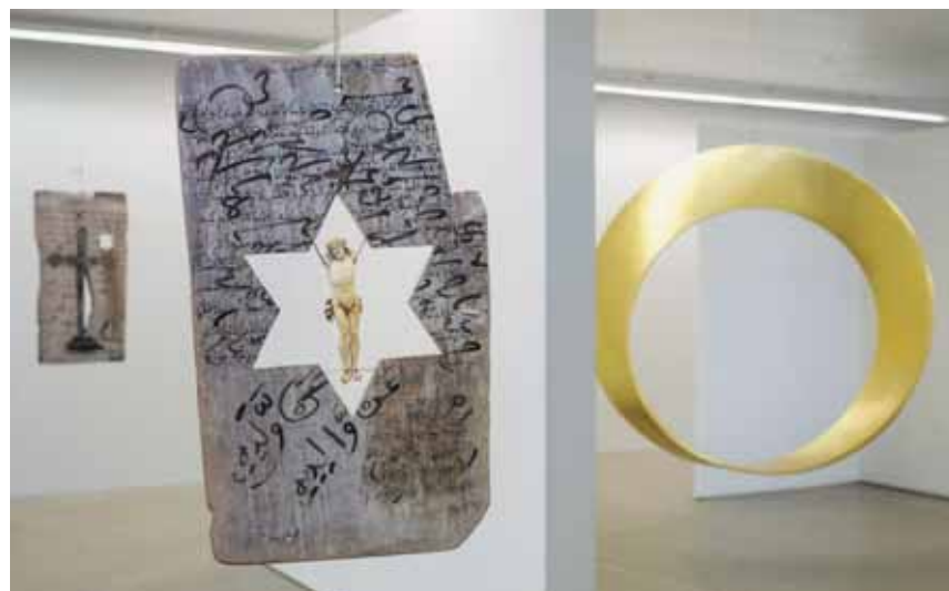
Une version moderne du Veau d'or côtoie les symboles de trois religions. CHRISTIAN GALLEY

Là, dans cette pièce, seul le crépitement des néons vient briser un silence recueilli, le même que l'on pourrait ren-