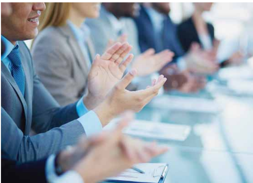
Savoir dire «bien joué!» ou «c'était super!» donne du sens à l'engagement professionnel des employés. SP

La place de l'individu en est radicalement modifiée, passant d'un système économique au service du bien-être des individus à des individus au service du développement du système. Le principal moyen de cette modification a été l'établissement de procédures d'évaluation censées mesurer en permanence le degré de conformité du travailleur avec des objectifs standardisés, périodiquement revus à la hausse.