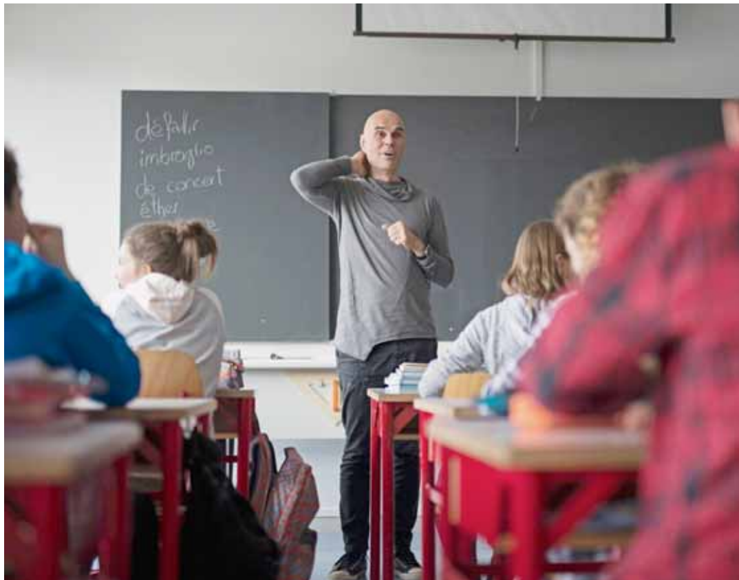
Pour Narcisse (en gris), le slam permet d'explorer ses émotions et d'en parler, dans un cadre où l'on est écouté. Une démarche poétique, par son fond comme par sa forme, qui séduit les élèves. DAVID MARCHON

Depuis trois ans environ, il anime également des ateliers, notamment dans les classes qui en font la demande, afin d'ouvrir les néophytes à ce mode d'expression particulier, qui fait la part belle aux anaphores, aux champs lexicaux, à la rime et aux émotions.