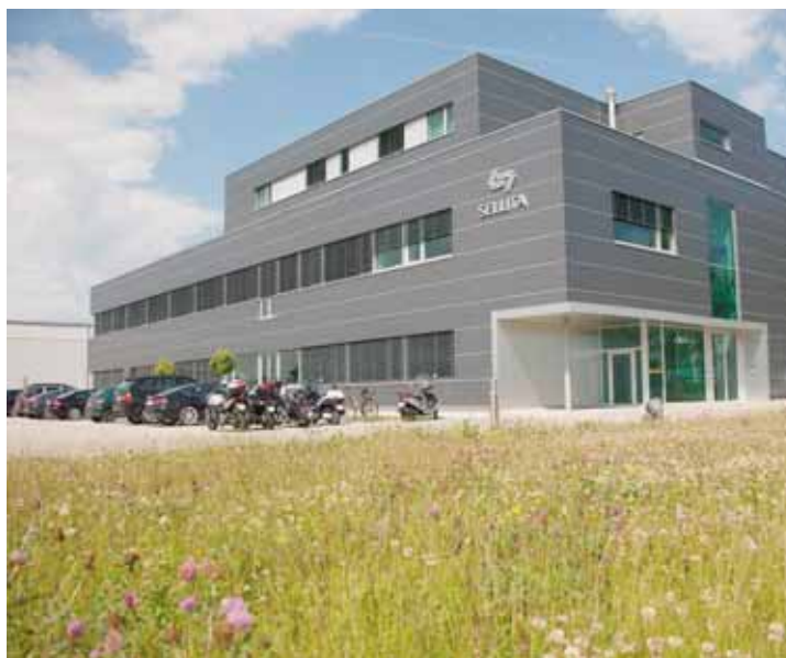
Sellita va s'agrandir au Crêt-du-Loche, malgré la mauvaise conjoncture. Un pari sur l'avenir.

«Pour nous comme pour toute la branche, la marche des affaires est en ce moment difficile. Mais nous croyons à ce que l'on fait et à l'avenir de l'horlogerie mécanique de qualité qui fait la force de cette ré-