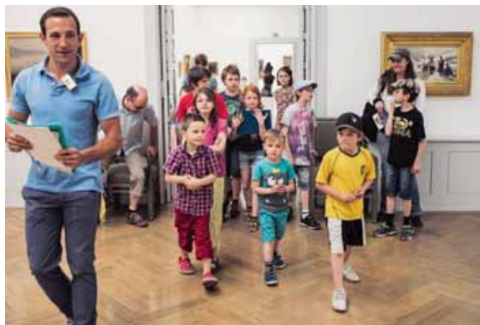
Peut-être une bonne nouvelle pour la station d'épuration. Les cadenas de Velospot à changer. Le Musée des beaux-arts quand il fêtait ses 150 ans 2014.

LA CHAUX-DE-FONDS Les rapports de sous-commissions du budget par le petit bout de la lorgnette.