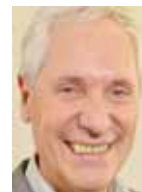
URS HOLDEREGGER PORTE-PAROLE DE L'OFFICE FÉDÉRAL DE L'AVIATION CIVILE (OFAC)