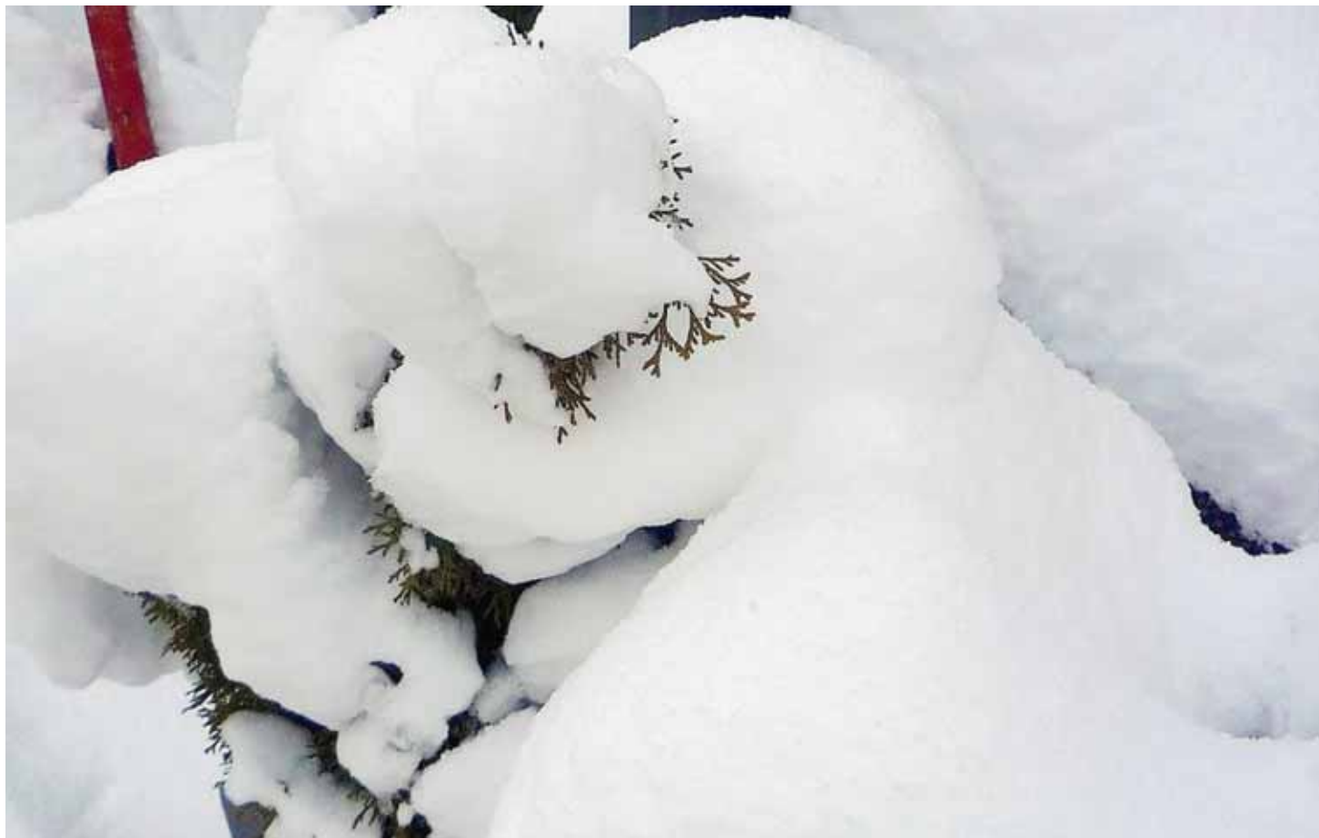
ABONDANCE «Quand la neige nous surprend», commente l'auteur de cette prise de vue bien de saison.