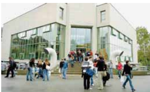
3000 Neuchâtelois pour cerner leur perception de ces «ovnis» télécommandés. «Plus de 600 personnes ont joué le jeu. Nous sommes en train d'analyser leurs réponses. On sent qu'il y a une crainte dans la population. Il nous faut la sonder. A priori, autant les gens semblent critiques sur les privés qui filment l'espace par profit ou par jeu, autant ils ont l'air d'approuver une telle surveillance par la police», esquissent les deux chercheurs.

Les travaux de recherche, subventionnés à partir de mars 2016, ont déjà commencé. Une conférence a eu lieu en août et un café scientifique est prévu en septembre 2016. Un questionnaire, élaboré avec une classe d'étudiants, a été envoyé à