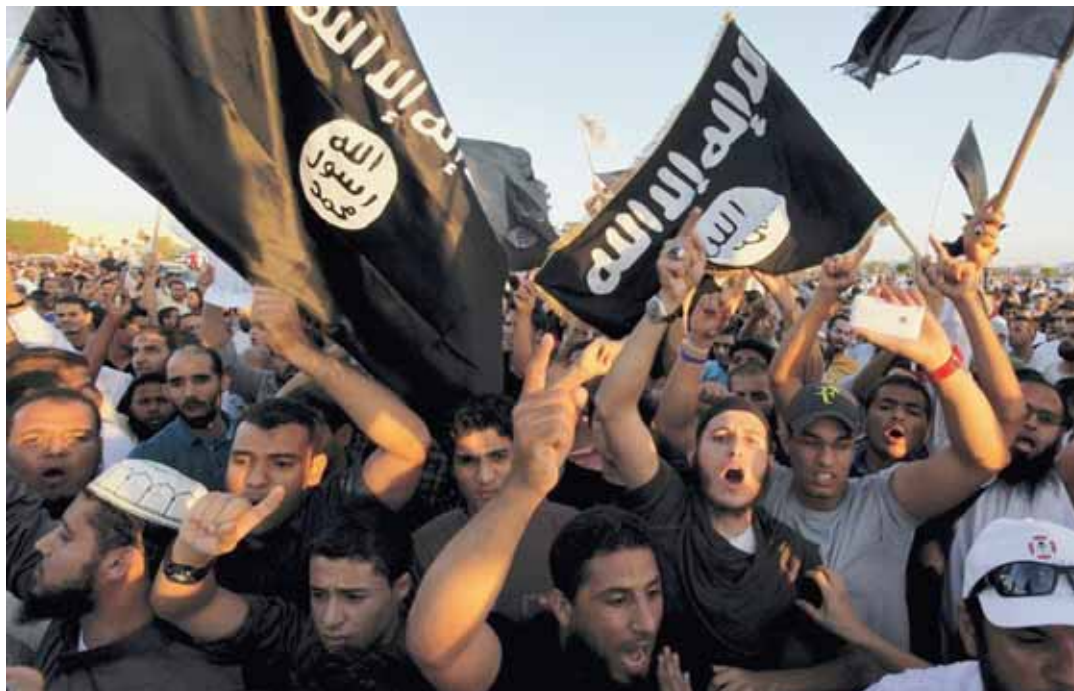
Manifestation en 2012 en Libye contre un film dénigrant Mahomet: l'organisation Etat islamique profite du vide du pouvoir pour étendre son emprise dans le pays du Maghreb.

Une source du ministère libyen des Affaires étrangères éva-