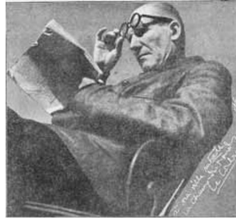
Le Corbusier, qui a dédié son portrait pour les lecteurs de «L'Impartial», ici en février 1948.

d'une permission spéciale. La Société lui réclame enfin 20 millions de francs français de dommages et intérêts. Pour elle, la Cité radieuse forme un type d'habitat présentant des «inconvenients d'ordre moral et contraires à l'esthétique et au style français».