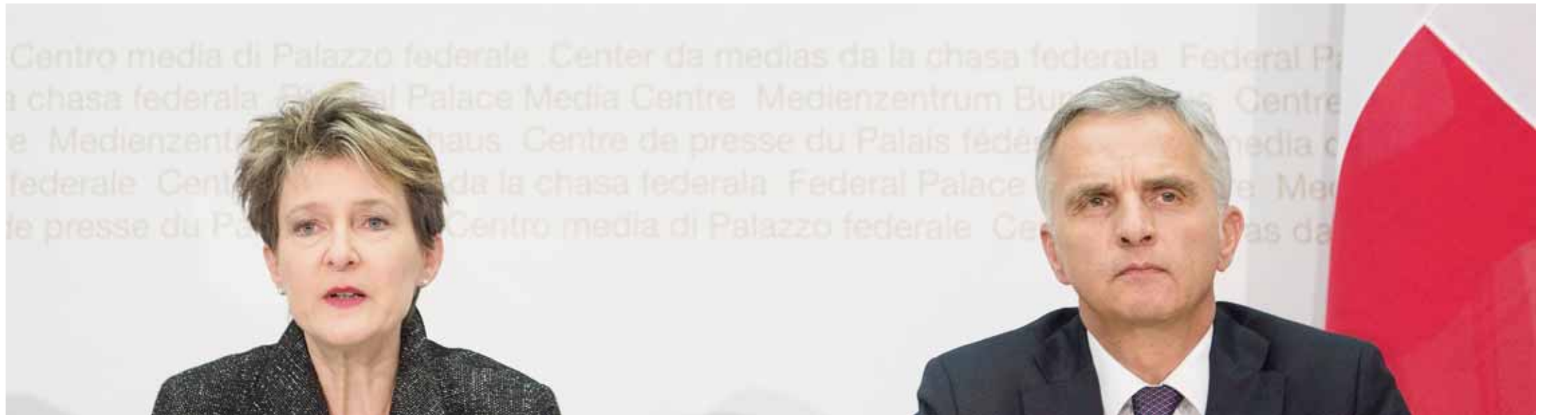
Simonetta Sommaruga, présidente de la Confédération et Didier Burkhalter, en charge des affaires étrangères, ont présenté leur plan de bataille pour faire appliquer l'initiative «Contre l'immigration de masse».

IMMIGRATION Le Conseil fédéral se prépare à mettre en œuvre l'initiative contre l'immigration de masse avec une clause de sauvegarde unilatérale. Mais la discussion n'est pas close avec Bruxelles.