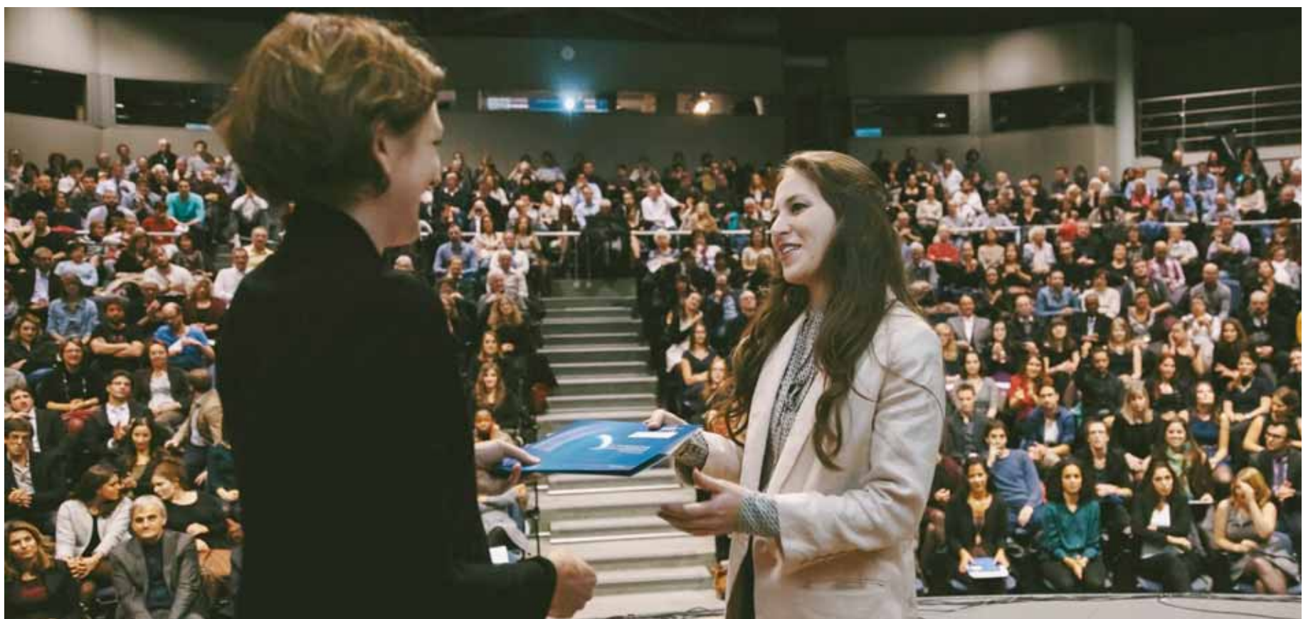
Plus de 100 masters et une vingtaine de doctorats ont été remis hier soir. Un joli cadeau d'avant-Noël qui a demandé des années d'efforts.