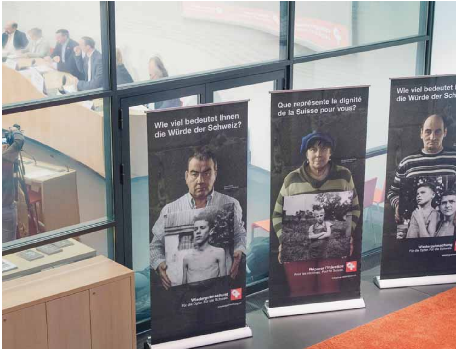
Les initiants estiment à 20 000 le nombre d'enfants placés encore en vie. Pour le Conseil fédéral, ils ne sont que de 12 000 à 15 000.

En effet, s'appuyant sur les chiffres avancés par des historiens, les initiants estiment à