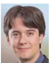
JEAN-CHRISTOPHE SCHWAAB MEMBRE DE LA COMMISSION DES AFFAIRES JURIDIQUES

« Le virage sécuritaire français n'a pas valeur d'exemple. »