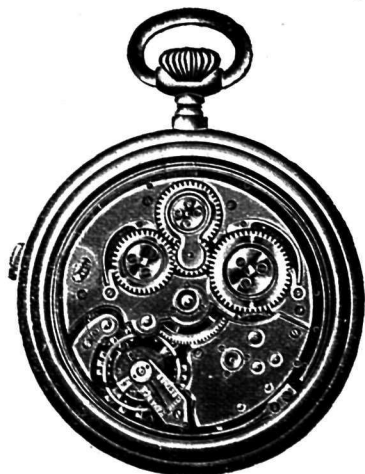
Rouage silencieux 5314

Calibre déposé Verre et savonnette 12 à 20 lig.