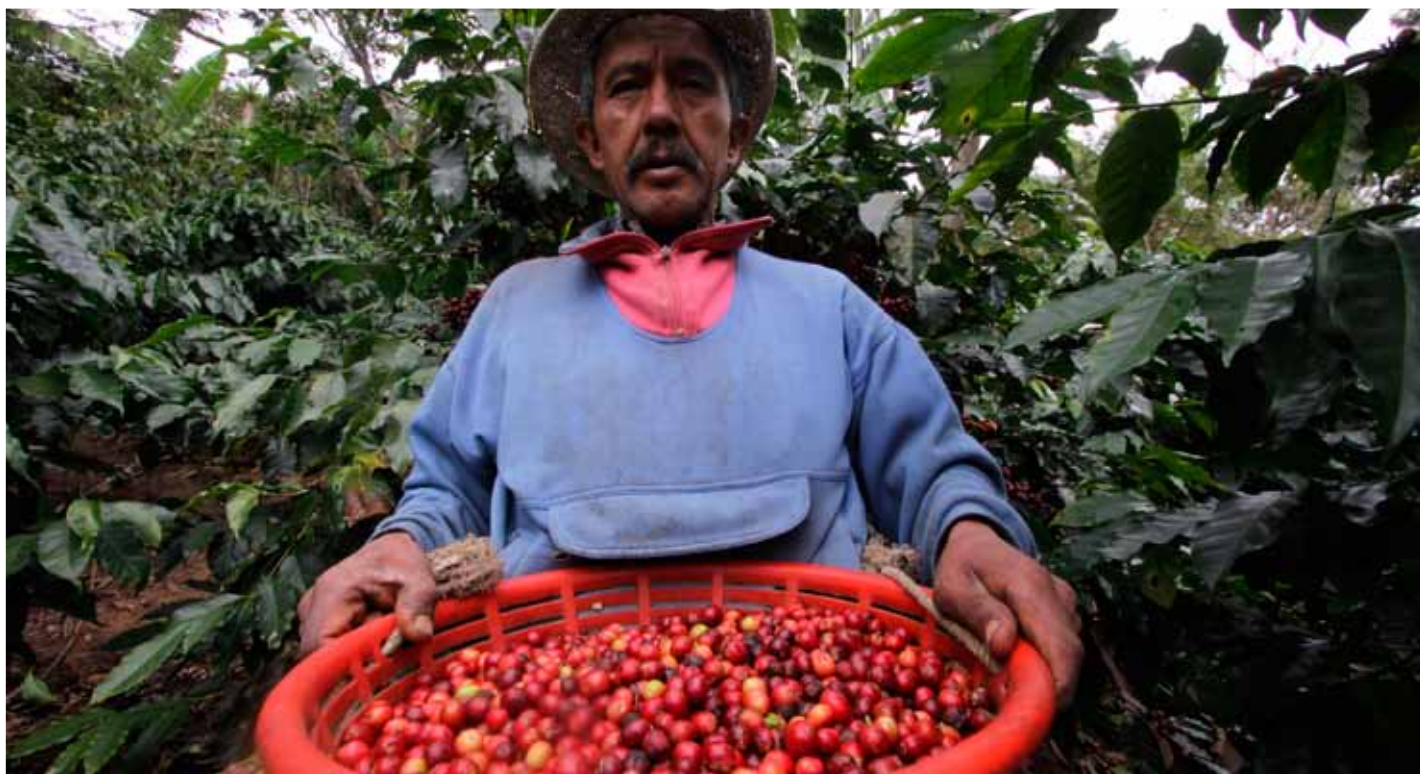
Efico sélectionne du café dans 36 pays à travers le monde

permet également de développer un nouveau portefeuille de clientèle qui comprend la petite et la moyenne torréfaction tant en Suisse que dans les pays limitrophes comme la France, l'Italie ou l'Allemagne.