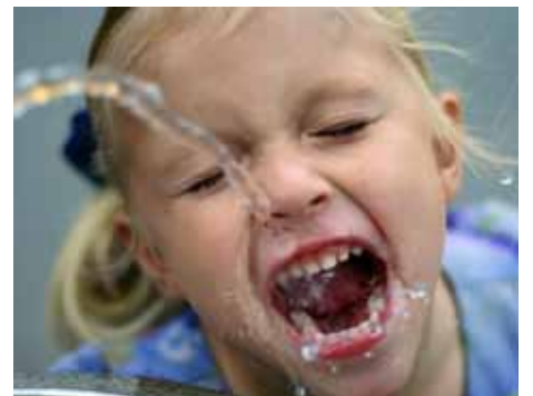
les entreprises de Suisse occidentale proposent des technologies innovantes de traitement de l'eau