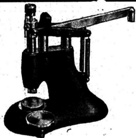
Nouvelle potence à chasser les pierres

Potences et outillages de précision pour chasser les pierres