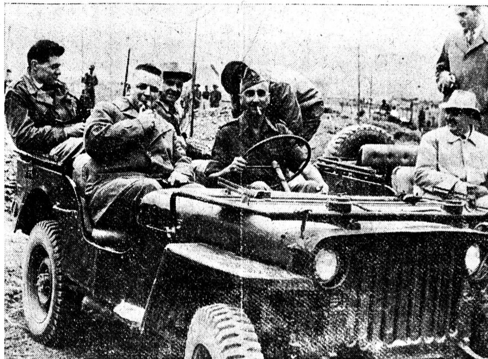
LUTTE A MORT A DIEN BIEN PHU

Des 10.000 t. de carburants qui, jusqu'ici, étaient mélangés à l'essence, la Confédération en achètera 2000, également au prix de revient, pour l'armée et les PTT.