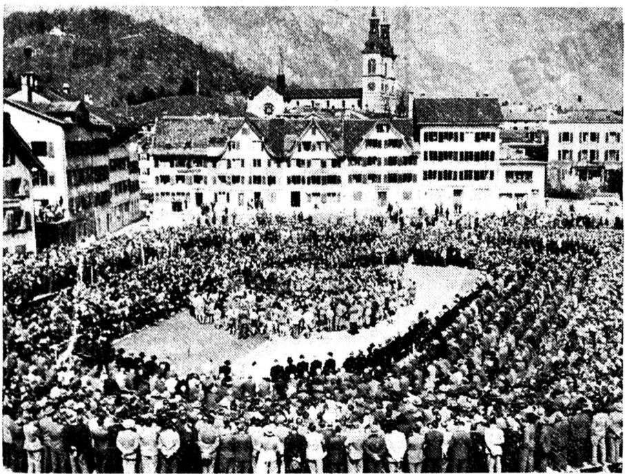
LANDSGEMEINDE A GLARIS

Dans un meeting syndicaliste: «Oui, camarades, les patrons nous ont assez lanternés avec leurs promesses. Nous allons tous faire grève et ceux qui travailleront seront des faineants!»