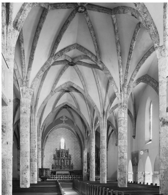
Vue intérieure de l'église Saint-Germain de Savièse, après la restauration de 1934

Professeur au collège de Sion, très cultivé, il a la réputation d'être sévère et exigeant mais aussi bon et juste. Sa fermeté fait merveille, car Savièse était l'une des paroisses les plus difficiles du diocèse. En effet, les rivalités politiques et leurs débordements donnent de fréquents soucis au curé qui tient les rênes de la commune au côté du président et du régent. Le curé Jean, préoccupé par le bien-être de la communauté, est proche de ses paroissiens. On le voit partout, encourageant les travailleurs sur les passerelles du bisse, enseignant dans les jardins des villages les plantations d'arbres, la taille, le sulfatage, négociant pour ses ouailles les marchés de fruits et de bois de noyer. Il sait