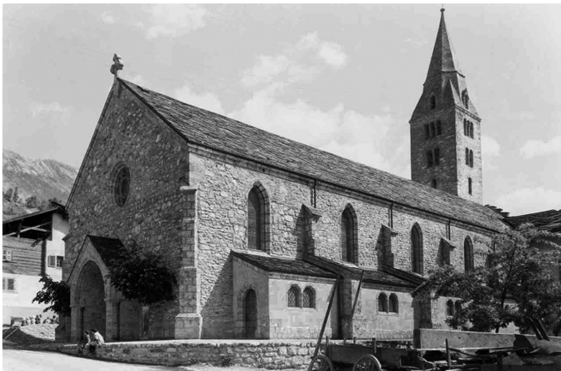
Eglise Saint-Germain, vue extérieure ouest, entre 1934 et 1945