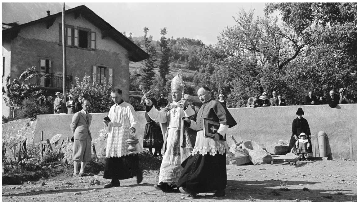
Bénédition du cimetière de Savièse, 28 mai 1934