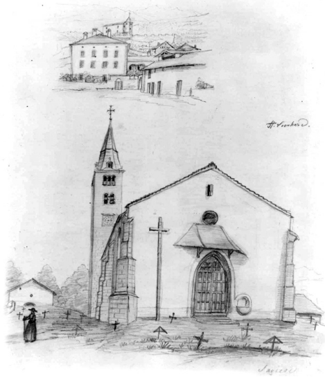
La plus ancienne représentation connue de l'église Saint-Germain de Savièse, Raphaël Ritz, vers 1860 (Etat du Valais, SBMA, Jean-Marc Biner, Sion)

En 1932, lorsqu'il accepte d'élaborer la décoration de l'église Saint-Germain, Biéler est âgé de soixante-neuf ans. Il a déjà derrière lui une carrière d'artiste-peintre reconnu. Il a également eu maintes occasions de développer, parallè-