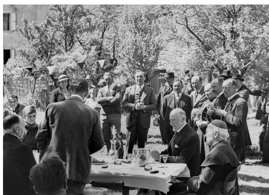
Bénédition de l'église de Savièse et du cimetière, 28 mai 1934