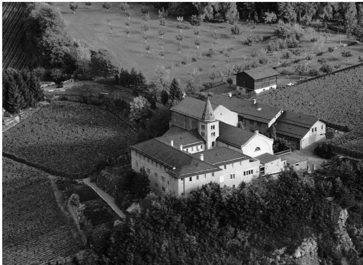
Monastère de Géronde, vers 1990 (G. Mathier)