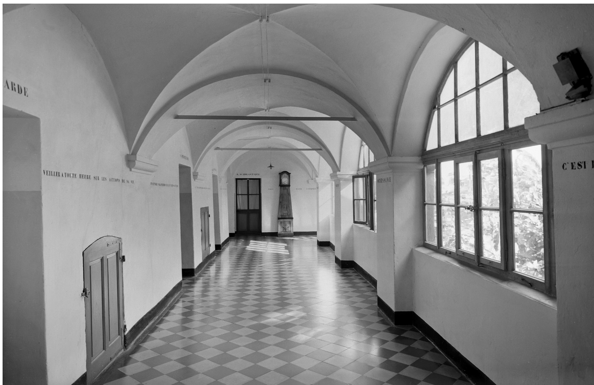
Intérieur du couvent, vers 1940