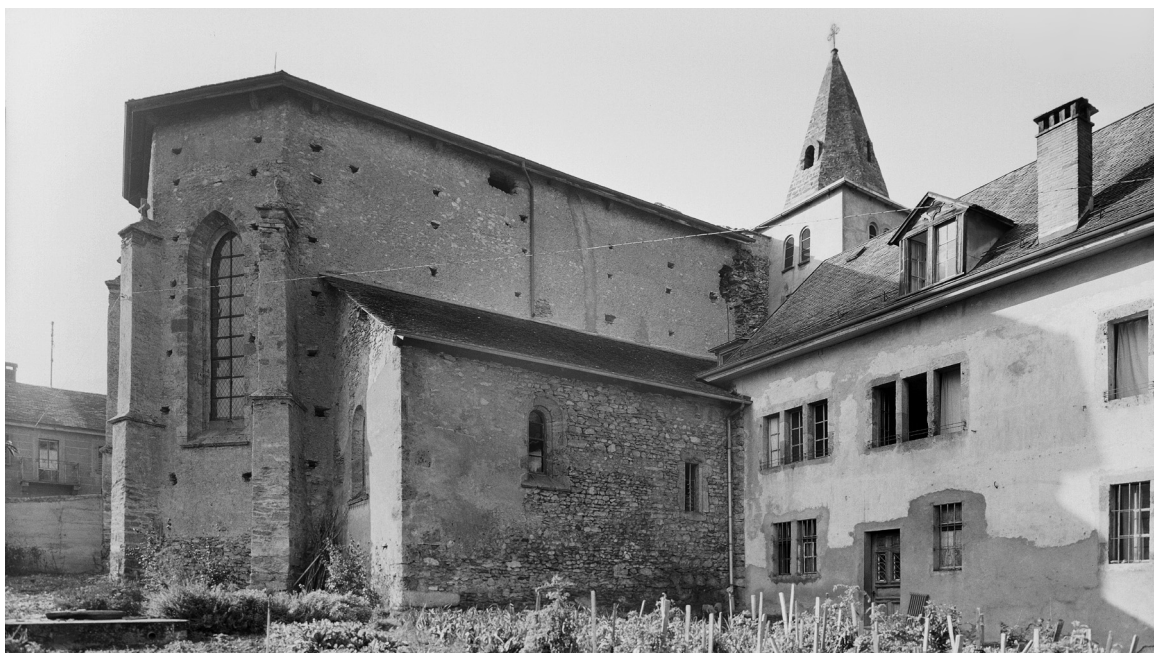
Eglise de Géronde et jardin potager, vers 1940