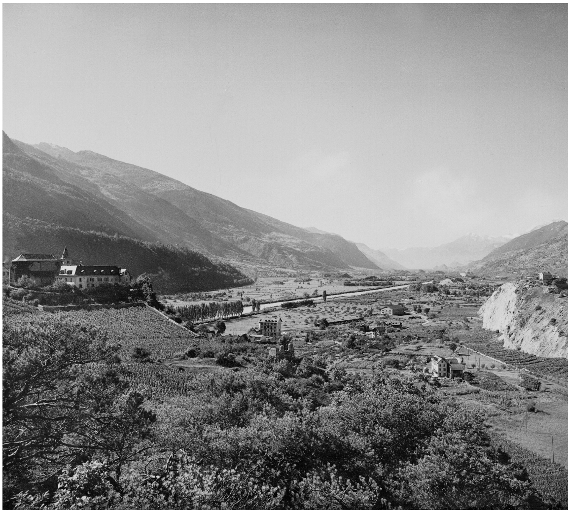
Géronde, vers 1930