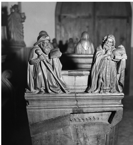
Stèles de l'église, vers 1940

Avec les Pères de la Compagnie, Géronde chargea son ADN de nouveaux gènes : ceux de la formation de la jeunesse et de l'exercice spirituel, de la culture humaniste et de l'art baroque, de la méditation systématique et de l'action apostolique dans le sens de la Contre-réforme catholique. En 1654 les Pères tenaient quatre classes et avaient à cette date déjà monté trois pièces de théâtre. Les années suivantes, ils construisirent un gymnase pour six classes. Il y eut une centaine d'élèves, encadrés par deux ou trois Pères. En outre, les Jésuites desservaient trois paroisses et exerçaient encore de nombreux autres ministères. Ils projetaient un collège avec gymnase et lycée, cours de philosophie et de théologie, soit le cycle complet de formation