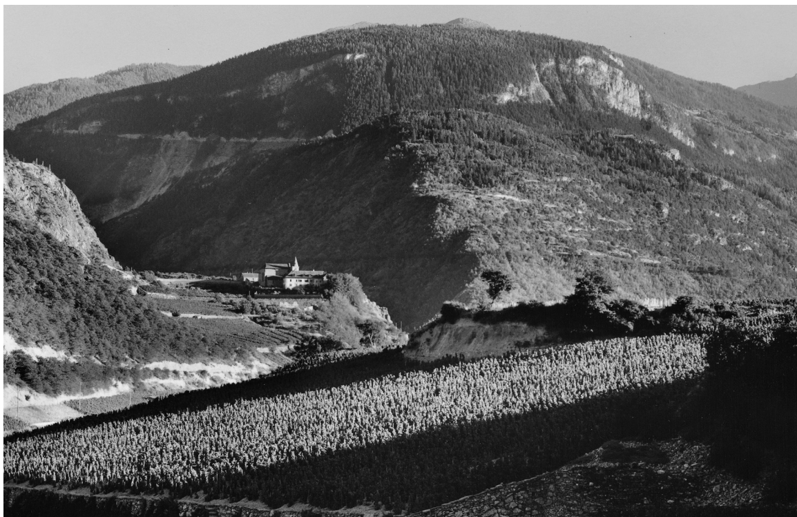
Colline de Géronde, vers 1935