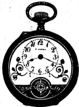
12" 8 Jours, acier, métal, argent et or.